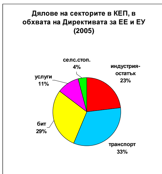
Фигура 2.5: Структура на крайното енергийно потребление в обхвата на Директивата (разпределение по сектори)

На фигура 2.5. е показано потреблението по сектори за 2005 година. За разлика от разпределението на общото крайно енергийно потребление, в което най-голям консуматор е индустрията (39%), тук в крайното енергийно потребление, в обхвата на Директивата, се вижда, че 62% от енергийното потребление е съсредоточено в секторите „Транспорт” и „Домакинства” .