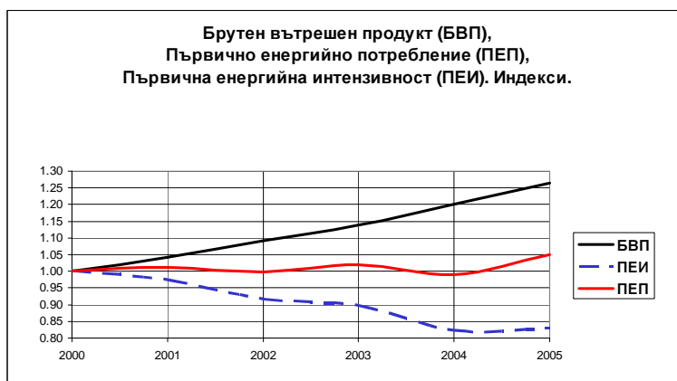
Фигура 2.3: Първична енергийна интензивност 5 – историческо развитие

Започналият процес на нарастване на потреблението на енергия в страната се обяснява с: