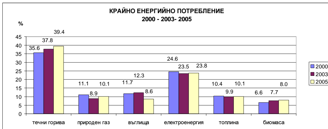
Фигура 2.4: Крайно енергийно потребление в периода 2000-2005 година.

Нарастващата употреба на течни горива и на дървесина за огрев, трябва да бъдат взети под внимание при определянето на приоритетните мерки по енергийна ефективност.